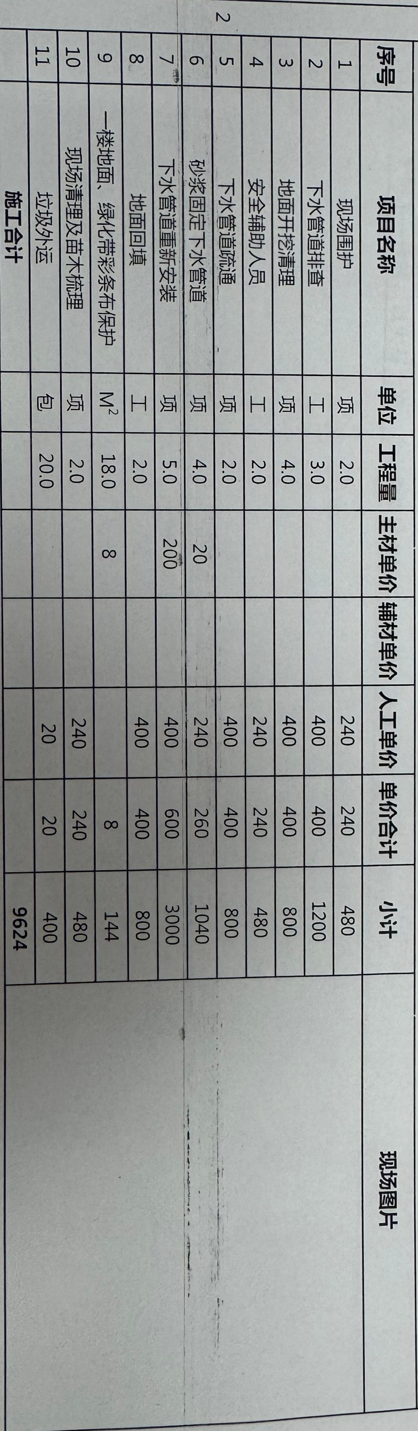
太湖华府尊园15单元污水管道及外网堵塞开挖维修预算报价单