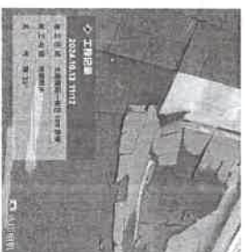
太湖国际社区一街区110单元1101屋面2处渗漏防水维修预算报价单